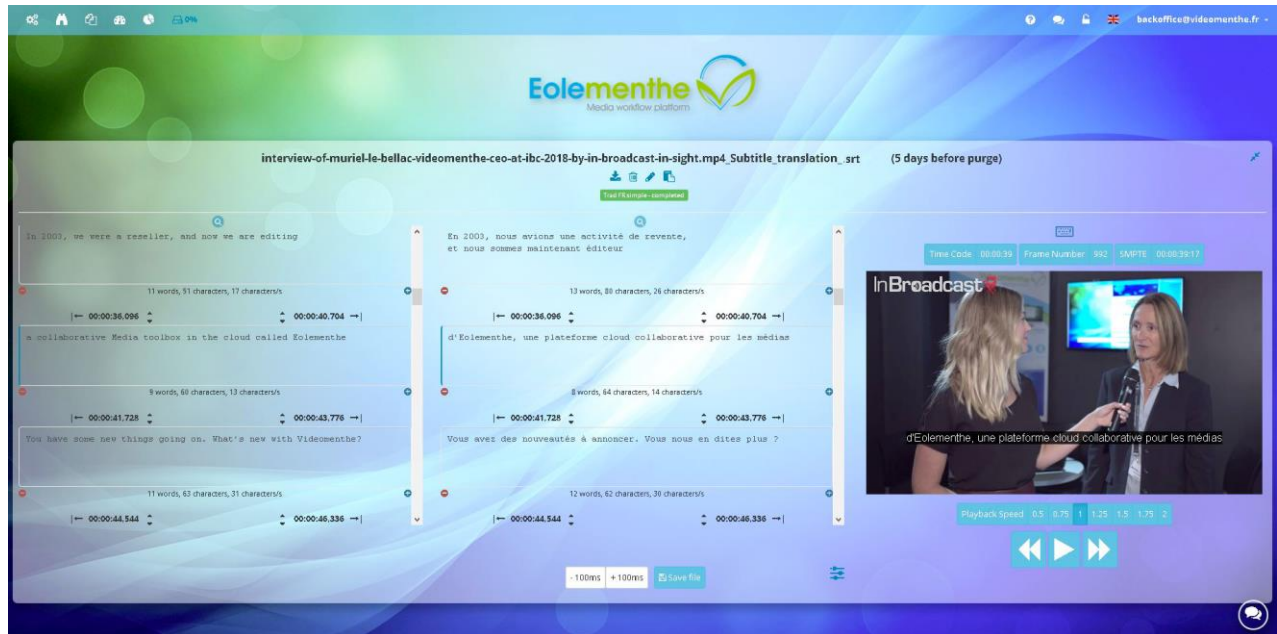
Filelib : option d'affichage en 3 volets

Autres évolutions : la possibilité de configurer l'habillage des sous-titres, pour répondre à une charte graphique spécifique, et l'ajout d'un outil de « chat », renforçant le travail collaboratif au travers de la plateforme.